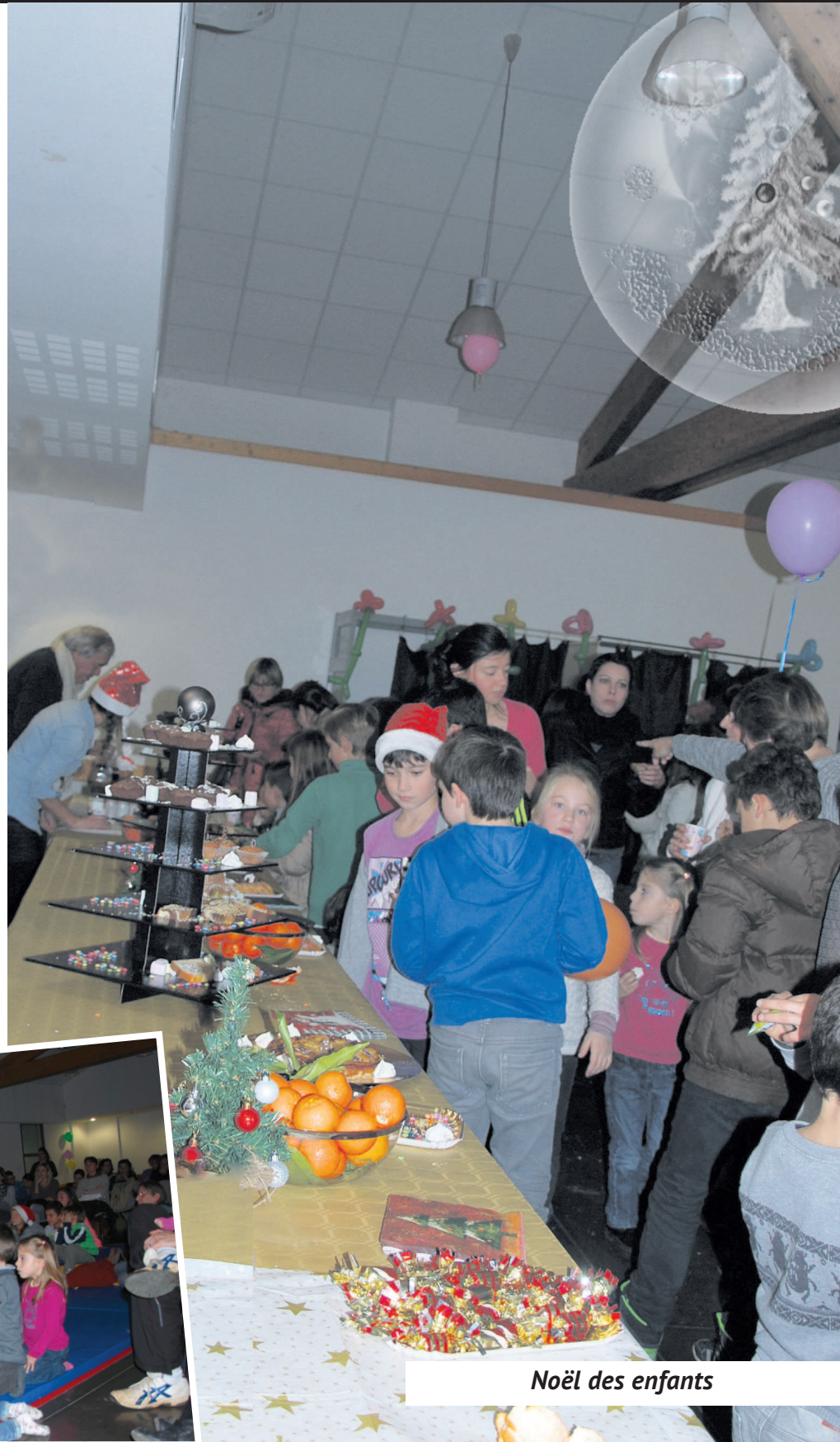
Noël des enfants