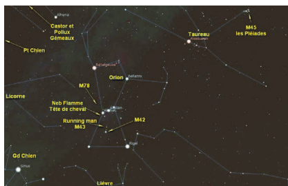
Image tirée de Stellarium un logiciel gratuit

Plus largement, elle est constituée de 7 étoiles très brillantes (en plus des 3 déjà citées) nous trouvons : Saiph, Bételgeuse, Rigel et une que les fans d'Harry Potter reconnaîtront vite: Bellatrix .