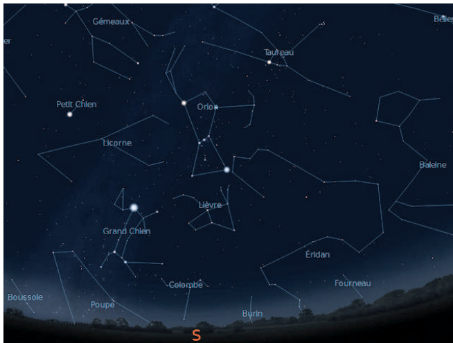
Image tirée de Stellarium

du ciel, ainsi que le Lièvre toutes entourent Orion l'archer céleste.