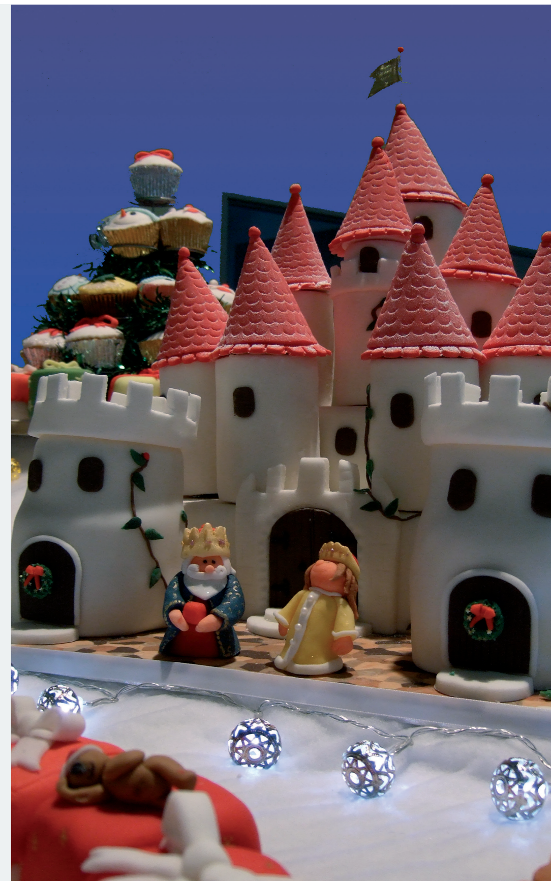
Photo ci-contre : un détail du gâteau géant offert pour Noël aux enfants de la commune. (voir article dernière page)

Spectacle Le mini concert pour les bébés à 10h 30 - Salle St. Etienne