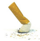
Filtre de cigarette 1 - 2 ANS