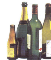
Verre 4000 ANS