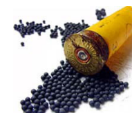
Plastique cartouche 100 - 1000 ANS