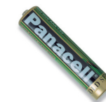
Pile mercure ETERNEL