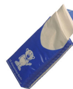
Mouchoir papier 3 MOIS

TEMPS DE DÉGRADATION DE NOS DÉCHETS DANS LA NATURE.