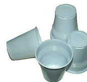
Gobelet en plastique 100 - 1000 ANS