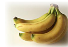
Pelure de fruit 3 - 6 MOIS