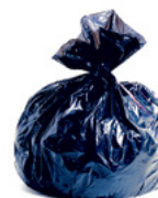
Sac en plastique 1000 ANS