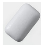
Chewing-gum 5 ANS